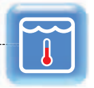
Serbatoio caldo in inox (versione CH) Hot water stainless steel tank (CH version)