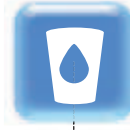
Portabicchieri Cup dispenser