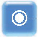
Tasto di sicurezza acqua calda (versione CH) Hot water safety button (CH version)